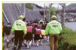
児童の付き添いパトロール