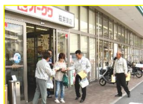
《児童虐待防止啓発の様子》