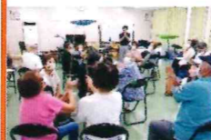
交流・つながりづくり