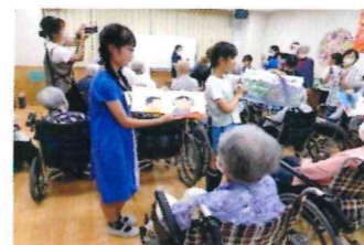
高齢者施設での交流(子ども読未知)