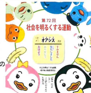
社会を明るくする運動ポスター(保護司会)