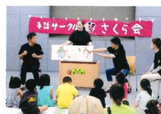
子どもに人気の絵本の世界を手話で表現(さくら会)

■集めた募金は、市内で使われています。 募金の約70%は、わたしたちの町を良くするため、残りの約30%は、広域的な課題を解決するため県内での活動に使われています。 ■災害にも赤い羽根共同募金は使われています。 募金額の一部は毎年「災害等準備金」として積み立てられており、災害発生時には、災害被災地で支援活動が行えるようボランティアセンターの開設・運営のための資金として、また被災した福祉施設の復旧支援に使われています。