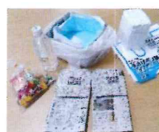
簡易トイレ、スリッパづくり