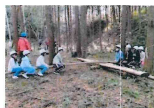
里山あそびの場を提供(彩雲ひろば)

彩雲ひろば …里山あそびの場の提供と整備、おとなとこどもの交流 NPO 法人おひさまひろば …クリスマス会 さくらい読書会「子ども読未知」 …絵本の読み聞かせと朗読ボランティア