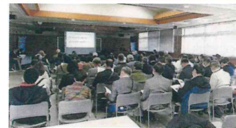
西日本豪雨災害を経験された民生児童委員の方にお話を伺う(民生児童委員連絡協議会)

桜井地区保護司会 …社会を明るくする運動 桜井地区更生保護女性会 …更生支援、青少年の健全育成 桜井市民生児童委員連絡協議会 …民生児童委員の役割のPR活動、他市町村の民生児童委員との交流など 桜井市自治連合会 …先進的なまちづくりの取り組みを学習 NPO 法人 Life for cats in NARA …地域猫と人が共存できるまちづくり