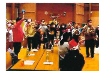
外出が難しい障がい者(児)が参加・交流(手をつなぐ育成会)

桜井市聴覚障害者協会 …聴覚障がい者への情報提供と地域住民相互の理解と交流 手話サークル さくら会 …聴覚障がい者と交流・手話学習 桜井市手をつなぐ育成会 …クリスマス会