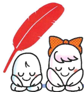
赤い羽根共同募金シンボルキャラクター「希望くん」、「愛ちゃん」