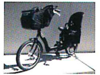
▲本会貸出の自転車 外観