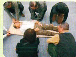
♡災害緊急時に備えての ボランティア体験訓練の実施のため