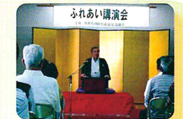
♡地区社協が主催する地域住民の ふれあい交流行事開催のために