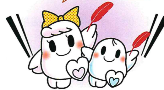
▲共同募金マスコットキャラクター 愛ちゃん(左)と希望くん(右)