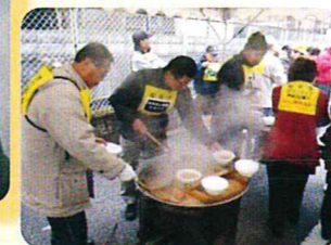
♡ボランティアグループが主催する 市民参加イベント開催のために