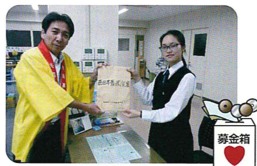
▲桜井高等学校から義援金をお預かりしました

※現在受付中の義援金については、奈良県共同募金会のホームページをご確認ください。 http://www.nara-akaihane.com/