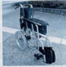
▲ 折りたたんだ状態