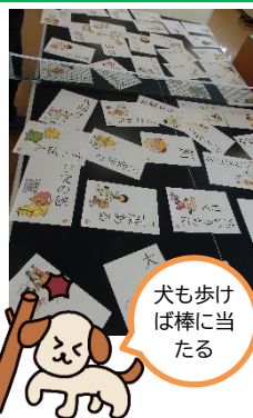
犬も歩けば棒に当たる

ことわざって、たくさんありますね。知っていることわざや、初めて聞くことわざを改めて学べるゲーム。かるた形式で、スピーディに展開します。最後は、各自の好きなことわざや、座右の銘を披露しあいながら、おしゃべりしました♪ 9月の第三弾は、バージョンアップですますます楽しい。お楽しみに(*。*)