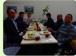
1階ワンカフェにてランチ