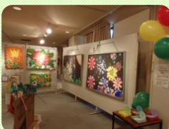
3階展示ギャラリー内

お昼はかしはら万葉ホール1階「ワンカフェ」にて、みんなでランチタイム！ほっと一息！館内にあるくつろぎスペースも利用しました。午後はおふさ観音へ、バラ園や庭園散策をして集合写真を撮りました。小雨の中でしたがウォーキングをして身体も動かし、メンバーさん同士のおだやかな交流ができました。ご参加いただきありがとうございました。来年も、社会見学を予定しています。アンケートの貴重なご意見を参考に、みんなで話し合い決めて行きたいと思います。今後もよろしくお願いします。