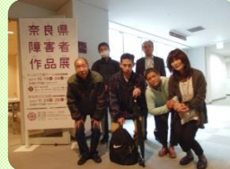
3階展示ギャラリー前