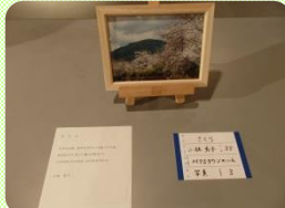
メンバーさんの作品