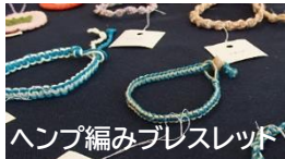
ヘンプ編みブレスレット