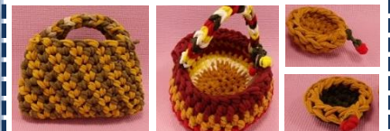
バック 手提げカゴ トレー