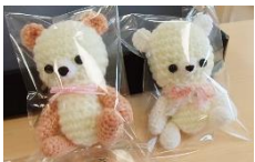
つぶらな瞳のクマさん編みぐるみ