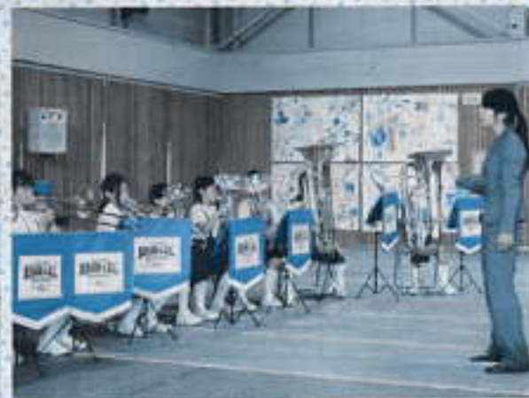
桜井南小学校管弦バンドによる演奏