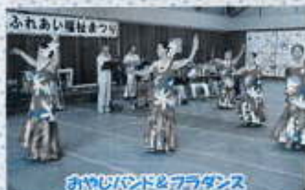
おやじバンド&フラダンス