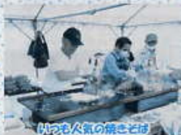
いつも人気の焼きそば