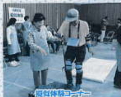
擬似体験コーナー