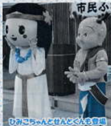
ひみこちゃんとせんたくんも登場