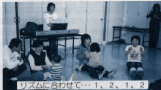
リズムに合わせて…1、2、1、2

4人の先生の指導によって、歌や楽器、手遊びなど5感を刺激する活動をしています。音楽を通して、子ども達の発達を促しています。