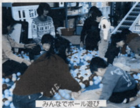
みんなでボール遊び