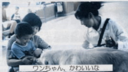
ワンちゃん、かわいいな

小さくかわいいワンちゃんや大きなワンちゃんとお友達になったりして、動物との関わりを通して、心の触れ合いを持ち、子ども達の発達を促す療育の一環として行っています。