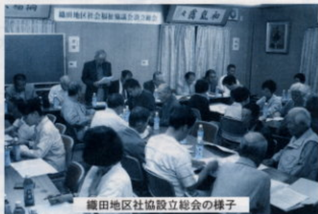
織田地区社協設立総会の様子

住み慣れた地域で安心して暮らせる「福祉のまちづくり」の実現を目指して、それぞれの地域が住み良いまちになるように、住民同士のふれあい、支えあいの輪を広げていくための地域福祉活動に、地域の特色を出した活動に取り組んで頂きたいと思います。皆様のご協力をお願いします。