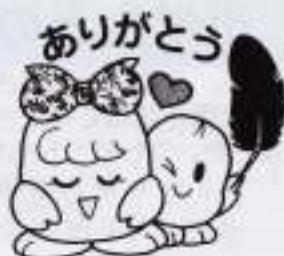
平成18年度赤い羽根募金実績額一覧表