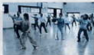
「体がついていがないわあー。」 （地区社協主催の太極拳）