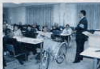
「防犯講習会」 (桜井署生活安全課長を招いて)