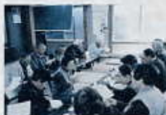
「ふれあいサロン」 (歌声タイム)