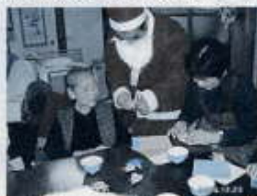
「サンタクロースと一緒に折り紙」 (芝区いきいきハウスにて)

地区社会福祉協議会（地区社協）は、「住み慣れた地域で、安心して暮らし続けたい」という、みんなの願いを住民相互の助け合い活動で実現へとめざす組織です。桜井市内では、小学校区を単位とした「地区社協」で、地域の実情に応じた取り組みが行われています。