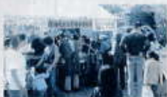
「いっぱい並んでくれはっどいさあいぞけ！」 （よっといで祭りて焼きそばを振る）

その他の事業として、研修会、講演会を行っていますが、地道な活動をこれからも心げ、地域福祉に貢献したいと考えています。