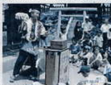
「よってらっしゃい、見てらっしゃい」 (地域の祭りで賑がしいバナナの印き売り)