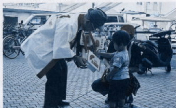
▲ 昨年の共同募金活動の様子

☆11/6(日)ウォーキングフェスティバル 8時～10時 場所：芝運動公園 市営プール前