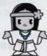
ひめこちゃん (桜井市マスコットキャラクター)